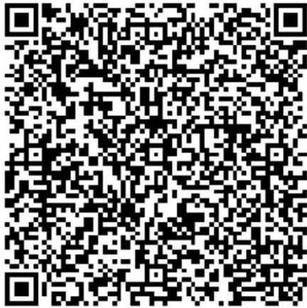
第二届全国大学生生命科学竞赛 决赛现场答辩录像